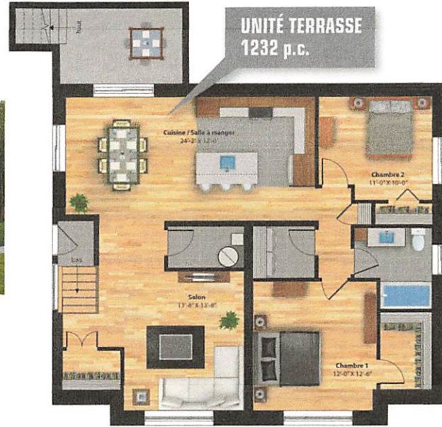
UNITÉ TERRASSE 1232 p.c.