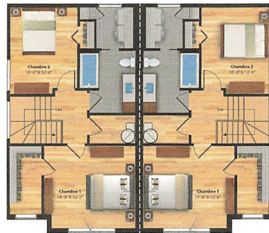
UNITÉ 2 ÉTAGES GAUCHE NIVEAU ÉTAGE = 612 p.c.